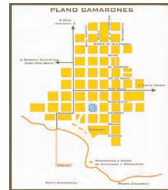
Figura N° 2