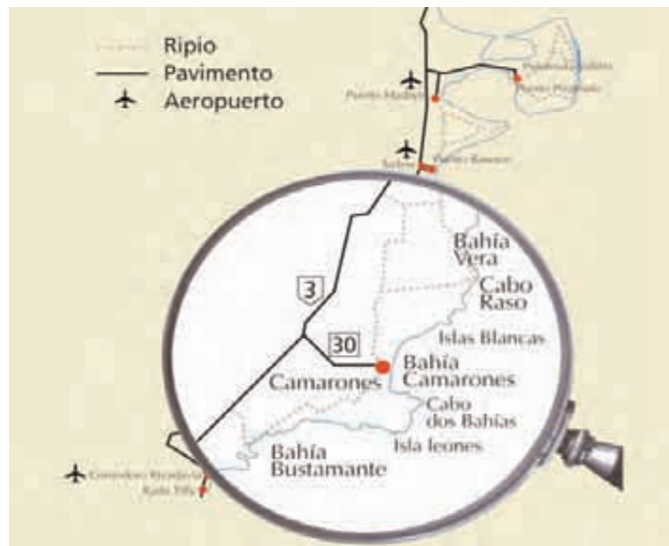
Figura 1 Mapa de localización.